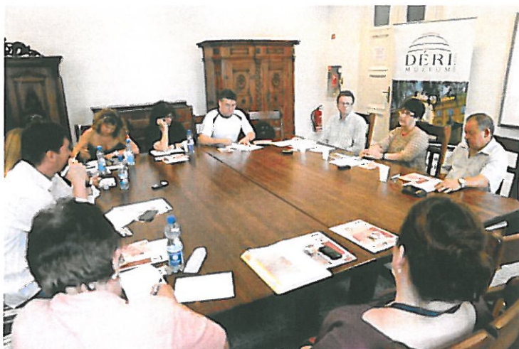
Képünk a fesztivál sajtótájékoztatóján készült

Debrecen – Idén nagyrészt ingyenes lesz az eddig fizetős Mézeskalács Fesztivál.