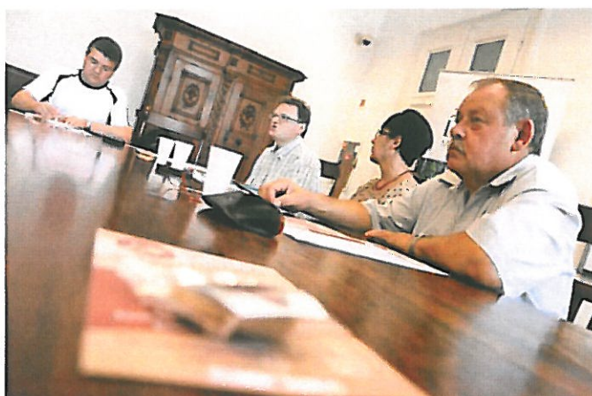
Egy hétvége a mézeskalács körül - © Fotó: Matey István

Debrecen – Új helyszínen, a Déri téren rendezi meg idén augusztus 16-án és 17-én a VII. Debreceni Mézeskalács Fesztivált a Déri Múzeum. Az ingyenes összművészeti rendezvényen gyerekprogramok és koncertek is várják az érdeklődőket.